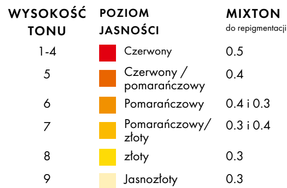
TABELA POZIOMÓW JASNOŚCI

Im jaśniejszy kolor podstawowy, tym większą rolę odgrywa mixton. Oznacza to: im jaśniejszy kolor podstawowy, tym mniejszą ilość mixtonu należy dodać.